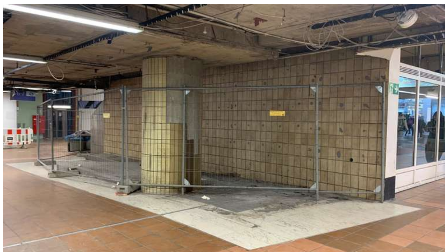
Der Snackstand von „Yorma’s“ im Hauptbahnhof Dortmund wurde abgerissen.

Dazu gehört auch der L-förmige „Yorma’s“-Stand an den Rolltreppen zur Stadtbahn. Der Stand mit Baguettes, Kaffee und Snacks musste Anfang April schließen. Weil die Arbeiten dort weiteren Platz benötigen, wurde das gesamte Geschäft abgerissen. Auch der Kiosk am Gleis ist geschlossen.