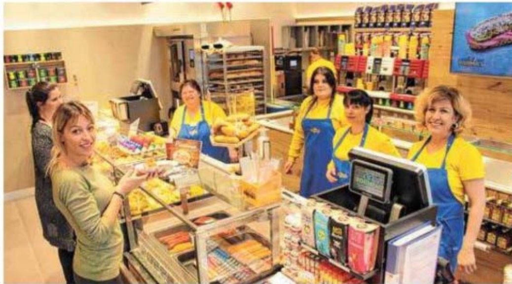
Das YORMA'S-Team Friedrichshafen

YORMA'S ein Spezialist für Reiseproviant: Vom belegten Baguette über frische Salate bis hin zum Mitnahmekaffee – YORMA'S versorgt unter anderem Reisende und Pendler mit leichten Mahlzeiten für Zwischendurch.